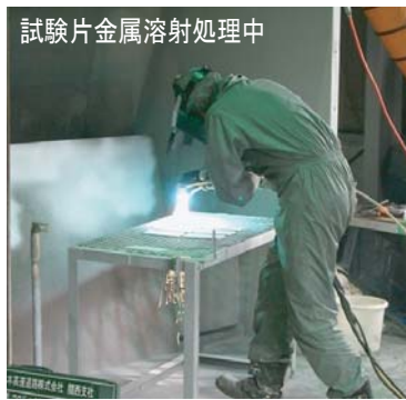
試験片金属溶射処理中