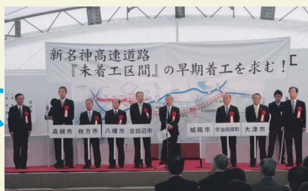
新名神高速道路『未着工区間』の早期着工を求む!