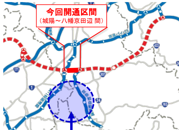
関西文化学術研究都市

京都・大阪・奈良の3府県にまたがる京阪奈丘陵において、国際的、学際的、業際的な文化・学術・研究の新たな展開の拠点づくりを目指す国家プロジェクトとして都市建設が進められている。