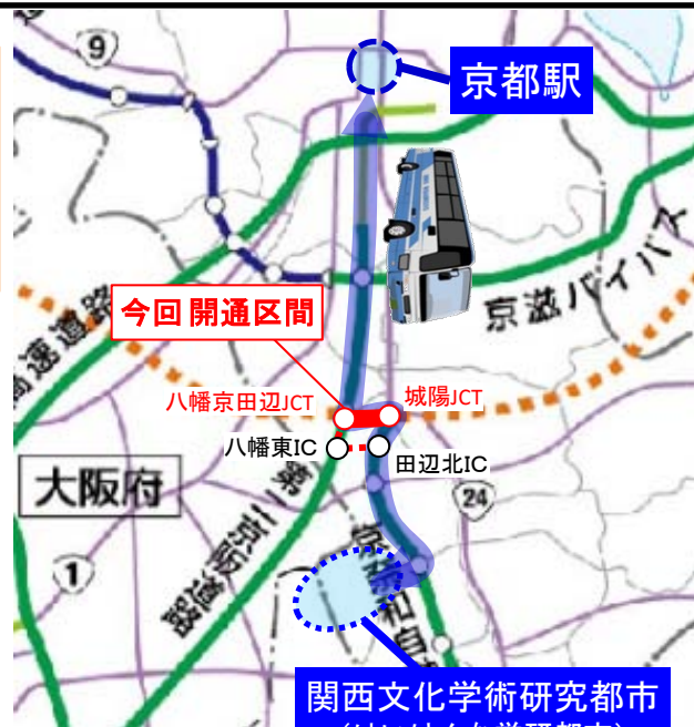
関西文化学術研究都市 (けいはんな学研都市)