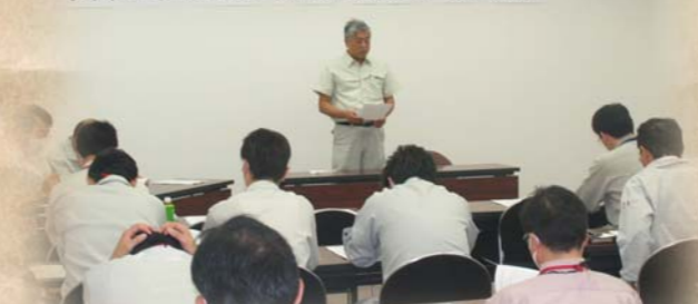
H21.5.28 兵庫工事事務所管内安全協議会設立 兵庫工事事務所管内安全協議会 設立総会

「無事故・無災害の達成」「よりよい品質を納める」を目標に兵庫工事事務所安全協議会を発足しました。