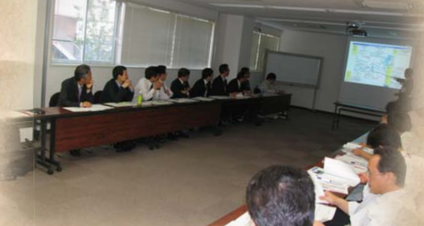
新名神関連事務所合同会議 H21.4.22

新名神建設事業に携わる 3 事務所が集まり、意見交換を行いました。一日でも早い完成を目指し事業を進めてまいります。