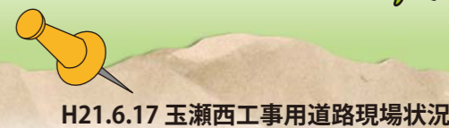
H21.6.17 玉瀬西工事用道路現場状況

新名神沿線のとあるところで見られるホタルの乱舞。開通後もこの風景が見られるよう自然を守りながら事業を進めてまいります。