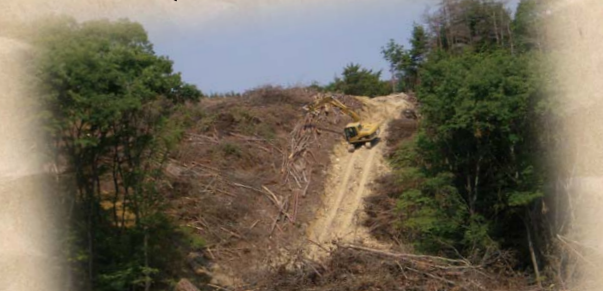
生野東工事用道路現場状況 H21.6.18

立木伐採が完了し、パイロット道路が概成しました。梅雨明けより、本格的な土工工事を開始します。