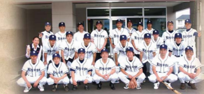
兵庫工事事務所野球部集合写真 H21.5.29

兵庫工事事務所の野球部がとうとうユニフォームを作っちゃいました。気分も新たに頑張っていきます。