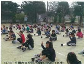
10/30 行橋市立今川小学校 65名(1年生)