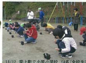
11/12 築上町立小原小学校 14名(全校生)