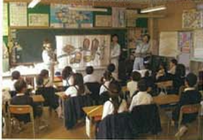
10/22 苅田町立片島小学校 22名(1・2年生)

表紙にも写真を掲載しておりますが、10月22日～11月12日にかけて、「記念の森づくり」種取りイベントを実施しました。「生活環境及び自然環境保全」の一環として実施したイベントで、東九州自動車道沿線の小学校にご協力頂き、生徒の皆さんと共にどんぐり(カシの木、シイの木等)の種を採取し、ポットに植え付けて頂きました。これらの種は、数年育成した後、今回参加して頂いた生徒の皆さんと一緒に、高速道路区域内に植樹する予定です。