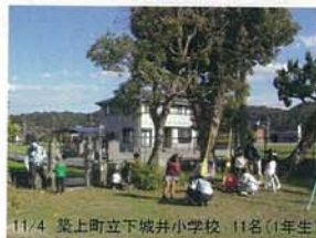
11/4 築上町立下城井小学校 11名(1年生)

表紙にも写真を掲載しておりますが、10月22日～11月12日にかけて、「記念の森づくり」種取りイベントを実施しました。「生活環境及び自然環境保全」の一環として実施したイベントで、東九州自動車道沿線の小学校にご協力頂き、生徒の皆さんと共にどんぐり(カシの木、シイの木等)の種を採取し、ポットに植え付けて頂きました。これらの種は、数年育成した後、今回参加して頂いた生徒の皆さんと一緒に、高速道路区域内に植樹する予定です。