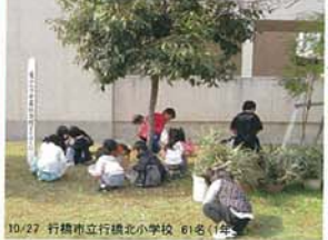
10/27 行橋市立行橋北小学校 61名(1年生)