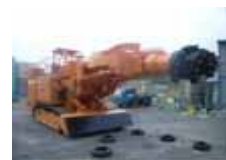
掘削機械：ロードヘッダー