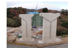
宇佐高架橋施工状況

また、宇佐工事については、土運搬が全盛期を迎えますので、引き続き安全管理に努めながら施工を行ってまいります。