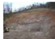
トンネル坑口箇所

トンネル掘削が進むと、昼間でも光の届かない場所での作業となりますが、事故なく早期に貫通出来るよう安全に工事を進めてまいります。