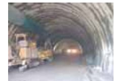
赤尾第二トンネル施工状況