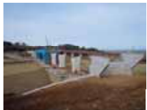
上ノ河内川橋施工状況