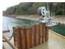
山国川橋施工状況

また佐井川橋（鋼上部工）工事がしゅん功を迎え、上毛工事区では2工事目のしゅん功となりました。友枝川橋の完成に伴い、これから唐原トンネルに着手します。唐原トンネルは国指定史跡である唐原山城跡の下を通り抜ける低土被りの特殊なトンネルです。延長は243mと短いですが、安全に努め施工を進めています。