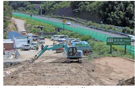
津田トンネル工事