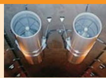
正解は本紙4ページに掲載しています。