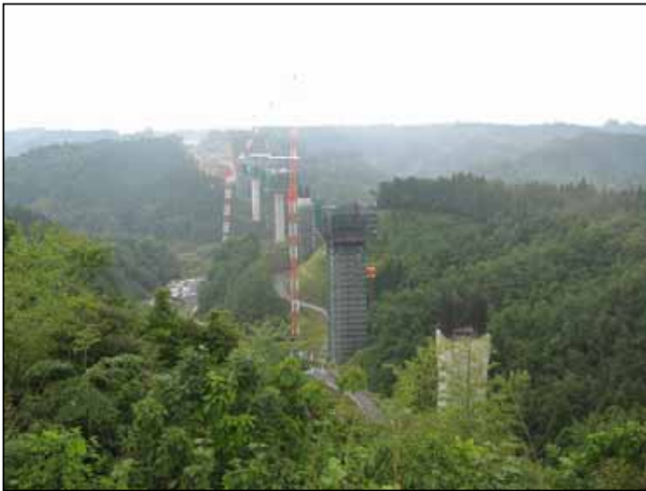
NEXCO西日本が工事を受託している橋梁工事

評価対象区間の延伸部分である大隅IC～末吉財部IC間(L=11.1km)は平成21年度に供用予定。 NEXCO西日本も、工事受託・技術支援を通じて事業促進に貢献。