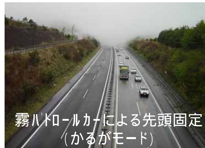
霧パトロールカーによる先頭固定 (かるがモード)