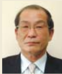
パネリスト 長岡秀人氏 /出雲市長