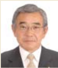
パネリスト 溝口善兵衛氏 /島根県知事