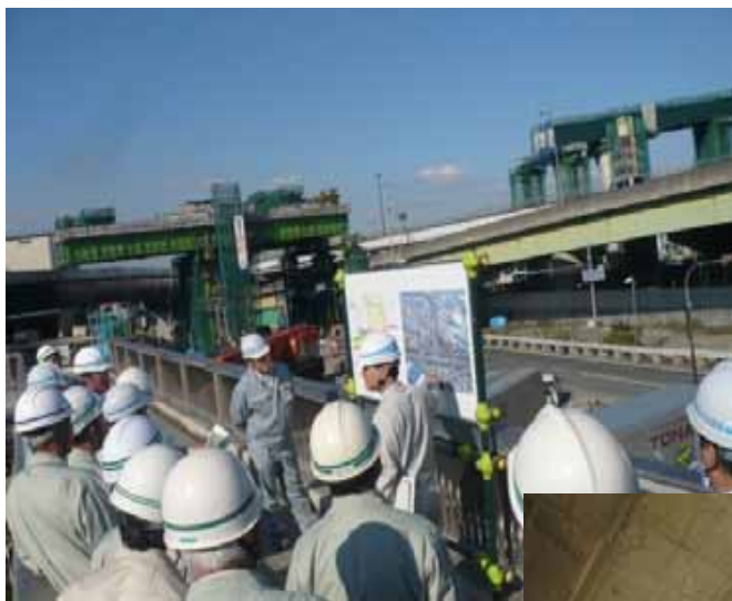
【現場講習会、技術交流及び技術提携会議】