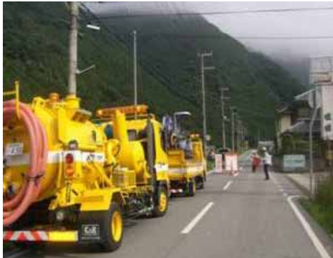
【災害時の復旧協力】