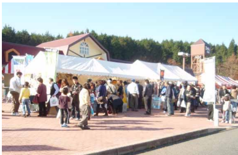
【県特産品の販売など】