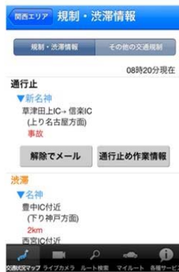
↑通行止め解除通知↑