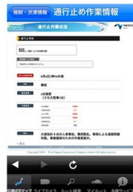
↑通行止め作業状況↑