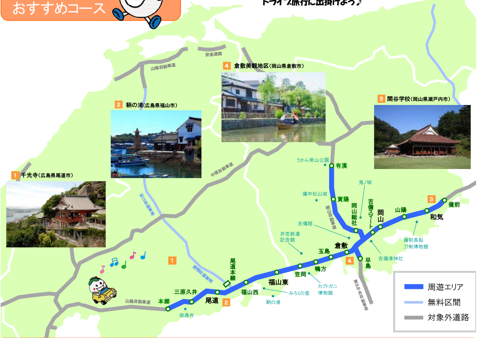
1 千光寺(広島県尾道市)