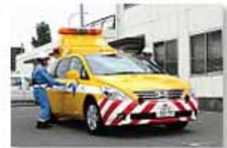
道路巡回パトロールカー