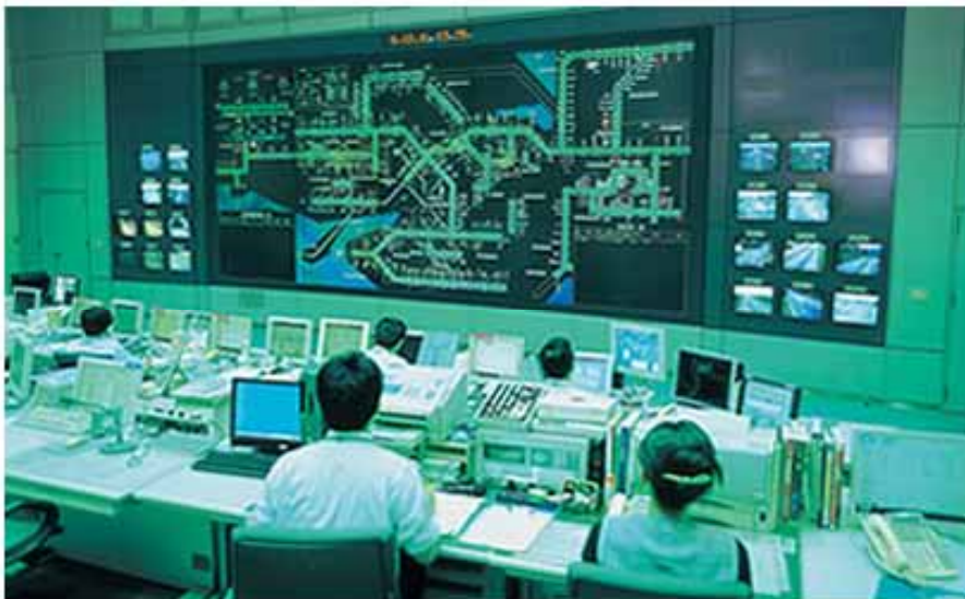
道路管制センター

道路管制センターでは、交通管理隊や高速道路交通警察隊の巡回、非常電話によるお客さまからの連絡、車両検知器、気象観測器、監視カメラなどから、交通事故や渋滞、異常気象などの道路情報を24時間体制で収集し、常に交通の安全確保に努めています。