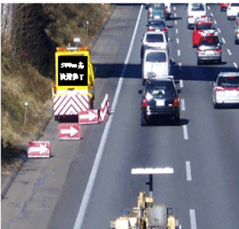
①「渋滞終了」をお知らせする表示