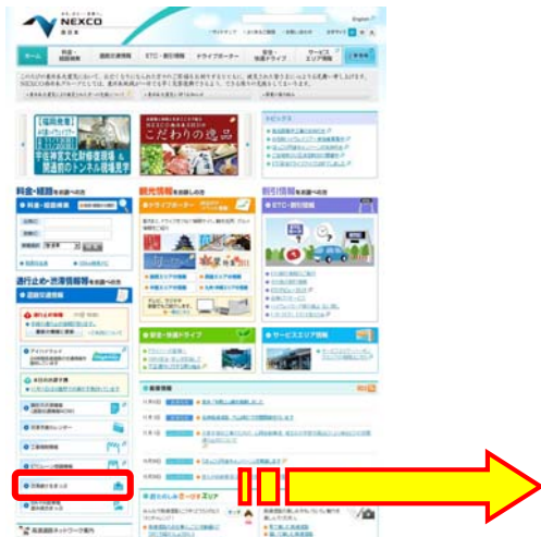
『SA・PA駐車場混み具合マップ』の掲載内容

混雑しているSA等の手前や先のPAが混雑していない場合がありますので、ぜひご利用ください。特に、お食事の時間などはSA・PAの駐車場は大変混雑することが予想されますので、この地図を参考にいただき、少しでも混み具合の低いSA・PAをご利用になれるか、ご利用時間帯をずらすなど、ひと工夫加えられることをおすすめします。