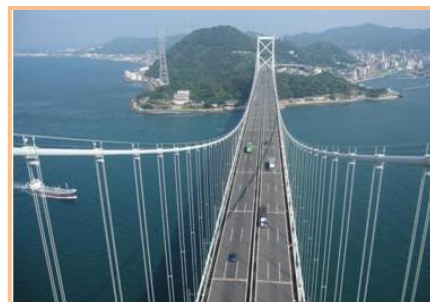
【関門橋主塔からの眺め】

本州と九州とを結ぶ自動車専用橋。全長 1068m。1973 年 11 月開通。今年の 11 月で開通 40 周年を迎える。