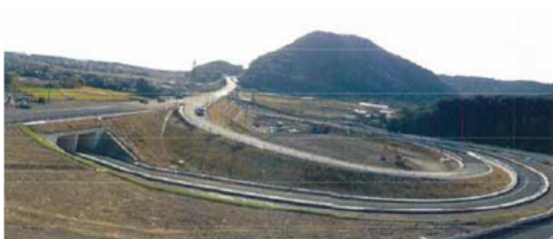
開通前の東九州自動車道を歩くのはまさに感動体験！2度とないチャンスです