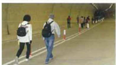
9月7日の第二伊勢道路開通ウォークでのひとこま