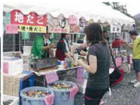
9月7日に催された第二伊勢道路開通ウォークの様子