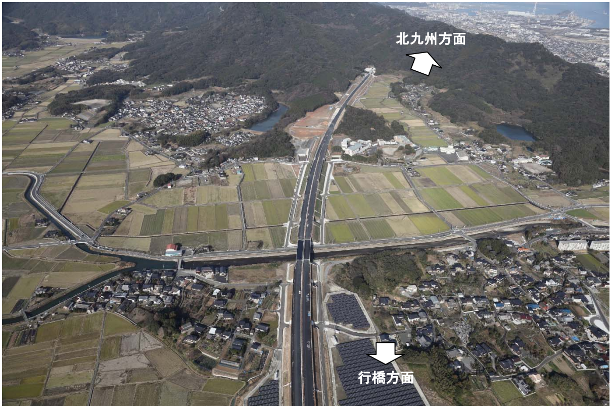
写真③ おばせがわ 【小波瀬川橋付近(京都郡苅田町大字上片島付近) 平成26年1月2日撮影】