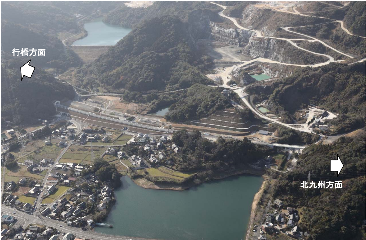
写真② みなみはら 【 みなみはら 南原トンネル北側坑口付近 平成26年1月2日撮影】