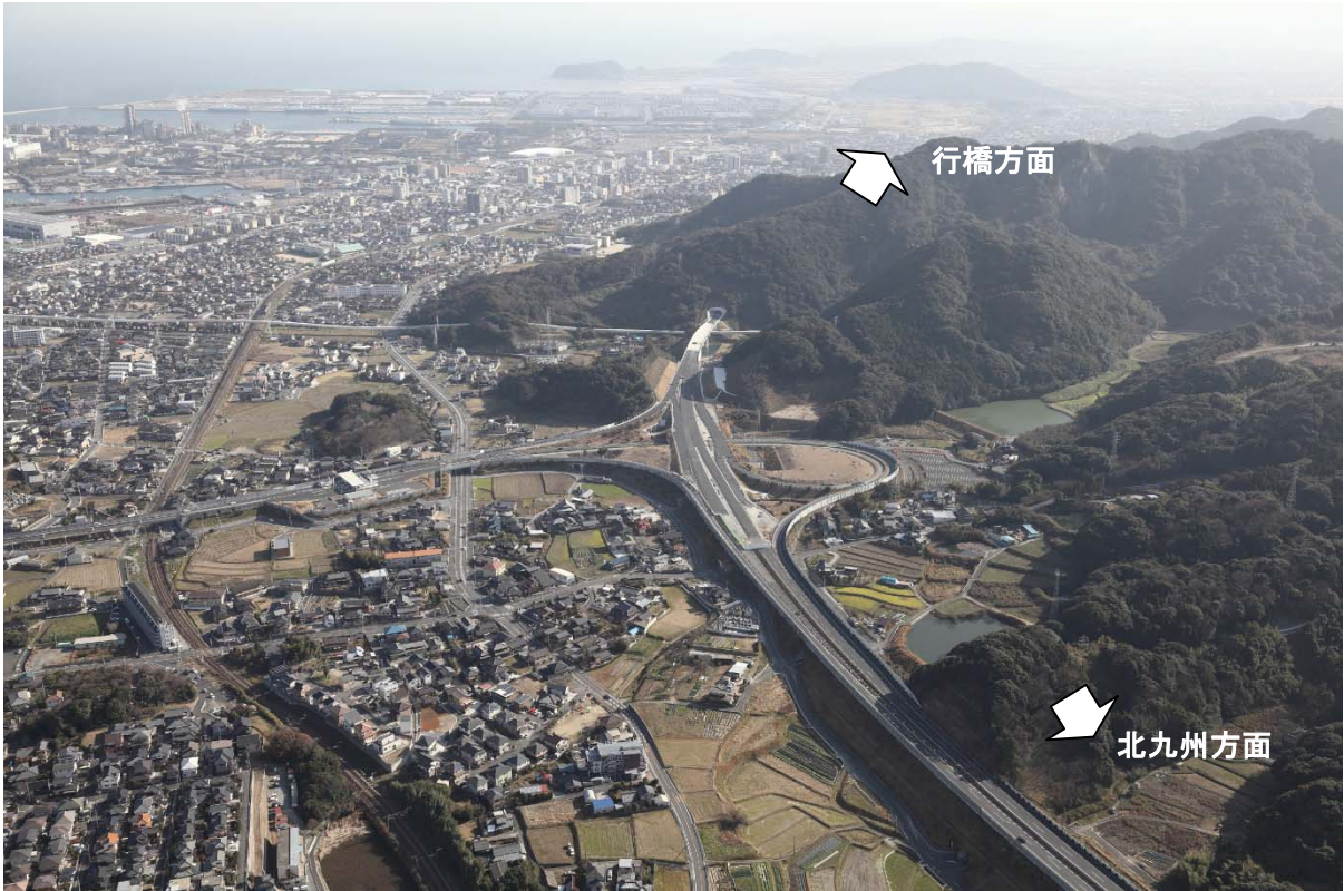
写真① かんだぎきゆうこうこう 【 かんだぎきゆうこうこう 苅田北九州空港インターチェンジ付近 平成26年1月2日撮影】