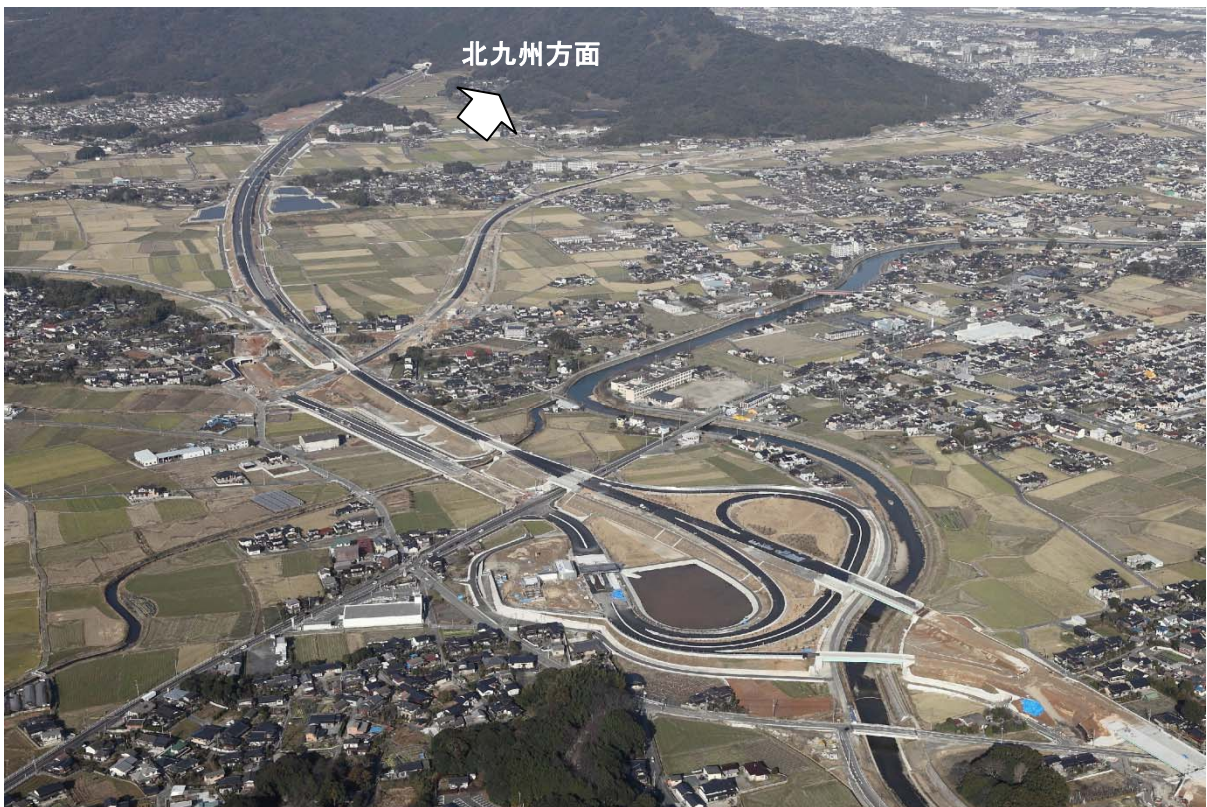
写真④ ゆくはし 【行橋インターチェンジ付近 平成26年1月2日撮影】