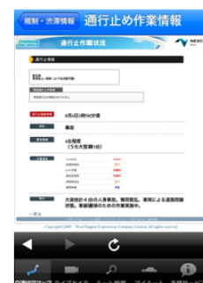
通行止め作業状況