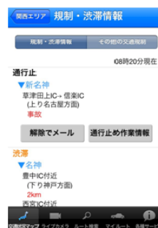
通行止め解除通知