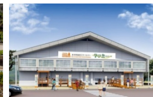
萩・世界遺産ビクターセンター学芸