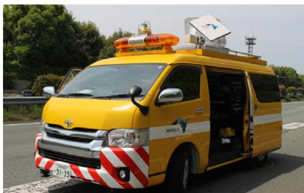
衛星車による情報収集