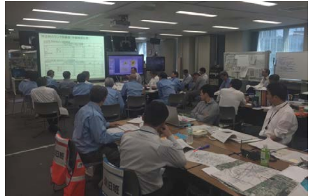
本社支社合同対策会議