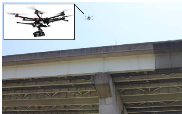
ドローンによる橋梁調査(並柳橋)