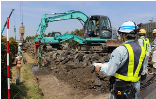
盛土復旧状況(益城BS付近)