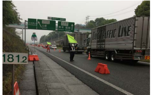
規制区間での安全啓発状況