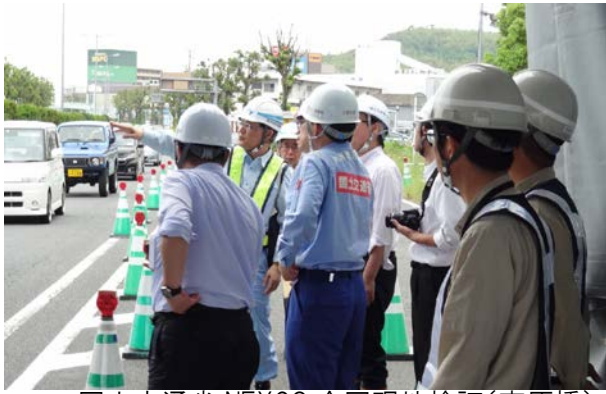
国土交通省 NEXCO 合同現地検証(東原橋)