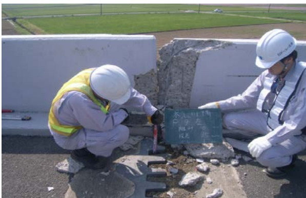
橋梁損傷調査(木山川橋)