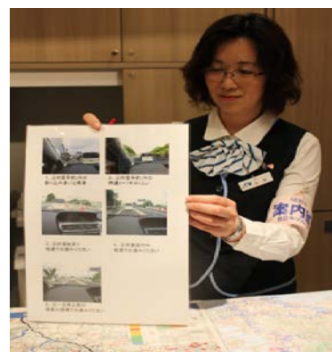
交通運用方法説明