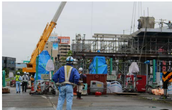
トールゲート撤去状況(熊本IC)