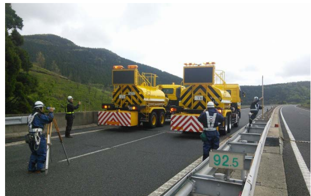
並柳橋載荷試験状況