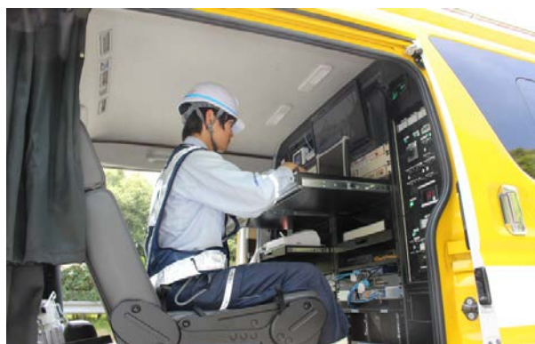
衛星車による情報収集