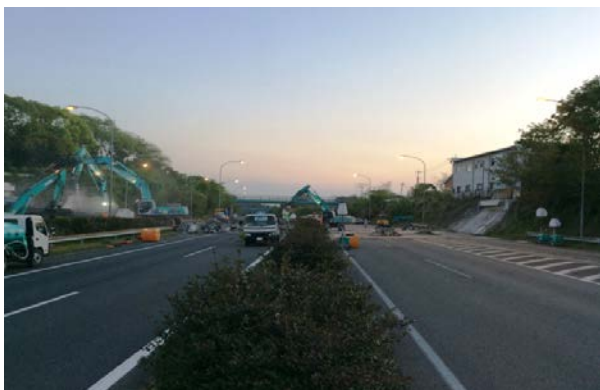
跨道橋撤去状況(府領第一橋)