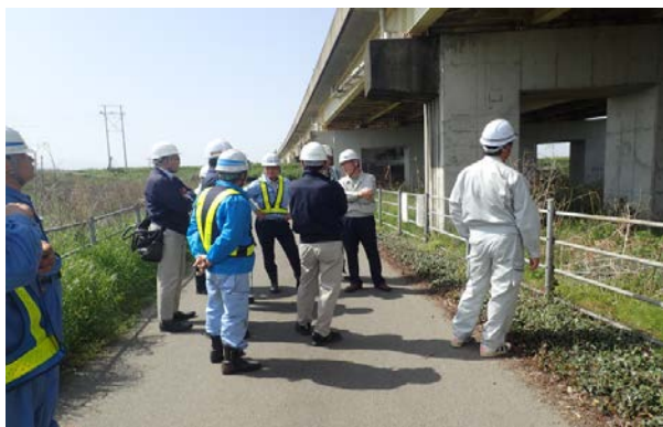
橋梁損傷調査(木山川橋)