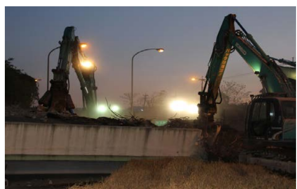
跨道橋撤去状況(府領第一橋)