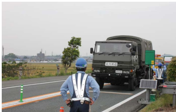
九州道規制区間前での一旦停止状況