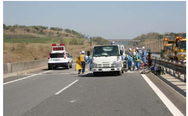
橋梁ジョイント補修状況