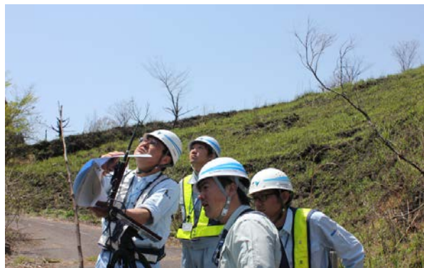
ドローンによる橋梁調査(並柳橋)