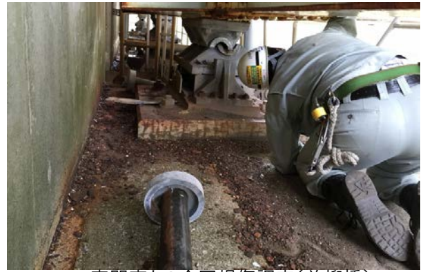
専門家との合同損傷調査(並柳橋)