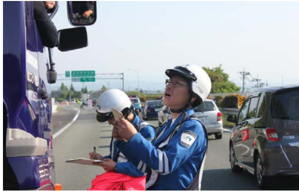
車両制限確認状況