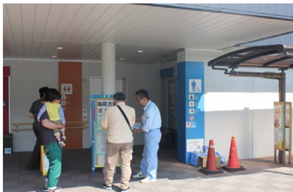
お客さまご案内状況