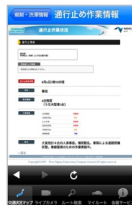
通行止め作業状況