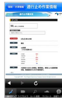
通行止め作業状況