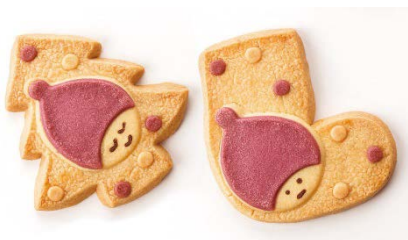
ニッセクッキー 各 432 円