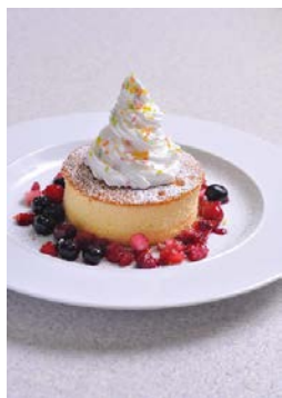
厚焼きパンケーキシングル