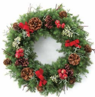
クリスマスリース 3,000 円～