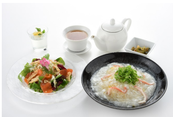
イルミネーション期間限定特別メニュー 「ズワイ蟹の餡かけ炒飯と海鮮サラダの中華膳」 1,400 円