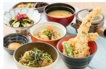
ロマン宿る海の道 むなかた三昧丼 1,620 円 (西イチグルメ決定戦 2017 本選大会進出メニュー)