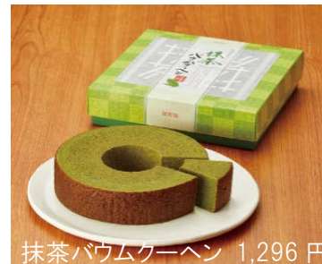
抹茶バウムクーヘン 1,296 円