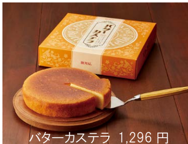
バターカステラ 1,296 円