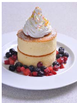
厚焼きパンケーキダブル