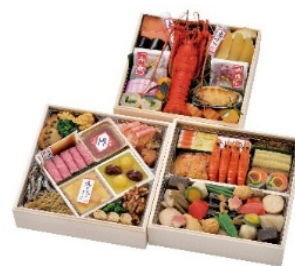
抽選会 1 等のおせち