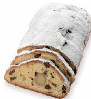
マンデルシュツレン S 1,566 円