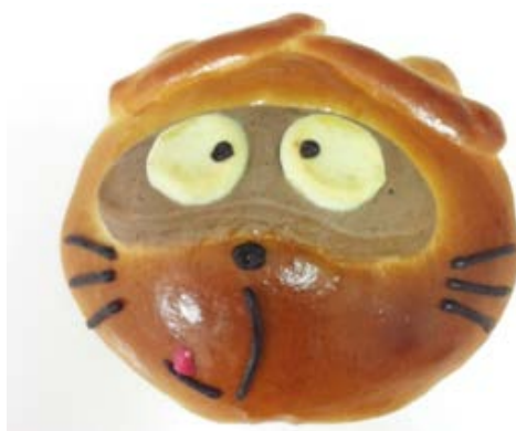
のん太のクリームパン 291 円