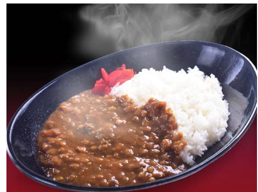
やしろ特製・ラーメン処の旨辛カレー (580円)

ほのかに香る生姜風味が特徴の自家製チャーシュー を使用した「ミニチャーシュー丼」