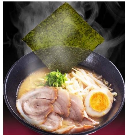
濃厚豚骨醤油ラーメン (790円)

濃厚スープに負けない150gの太麵を使用 ガッツリ食べたいお客さまに是非ご賞味いただきたいラーメン