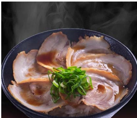
ミニチャーシュー丼 (330円)

ほのかに香る生姜風味が特徴の自家製チャーシュー を使用した「ミニチャーシュー丼」