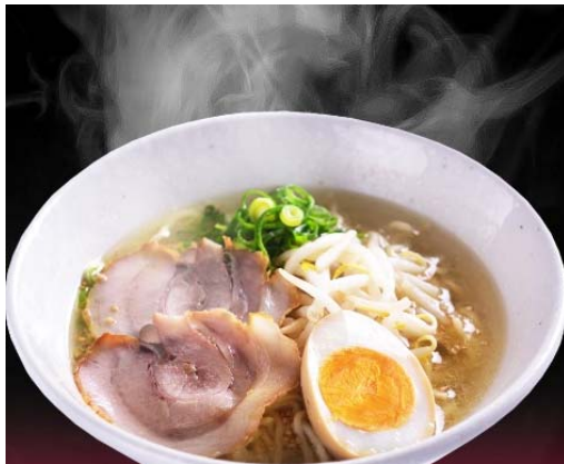
やしろ塩ラーメン (490円)

「播州ラーメン」に加え、あっさり系の「やしろ塩ラーメン」と、こってり系の「濃厚豚骨醤油ラーメン」の2種類が新登場！