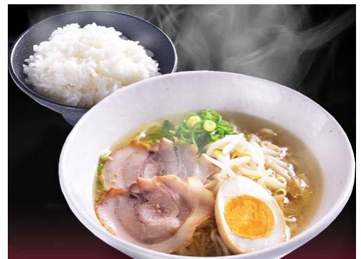
特朝ラーメン定食 (590 円)