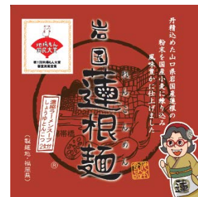
岩国蓮根麺 尾道風しょうゆ豚骨 2 食入り (612 円)

※掲載しているメニュー写真はイメージです。盛り付けは実際の提供時と異なる場合があります。