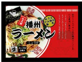
当店自慢のあの味がご自宅でも味わえます 播州ラーメン 2 食入り (594 円)

ショッピングコーナーでは、NEXCO西日本が管轄する24府県にちなんだ各種ラーメンを取り揃え、ご自宅等でも気軽に各地域のラーメンを楽しめるコーナーへと一新。このリニューアルにあわせて、新たに取り揃えた商品の中から“自分好みのお好きな味を探す旅”をお楽しみ下さい。