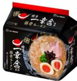
一幸舎監修 豚骨ラーメン 5 食入り (702 円)