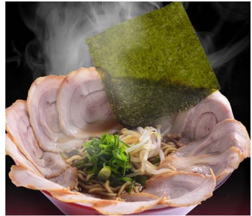
チャーシュー麺(播州) (790円)