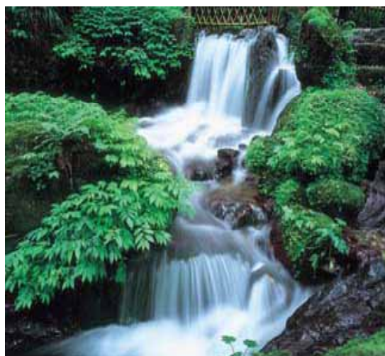
【若狭瓜割名水公園瓜割の滝のPR】