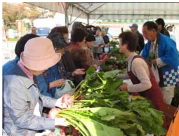
【産地直送野菜の販売】