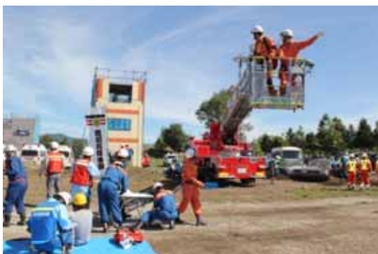
【災害時の復旧協力】