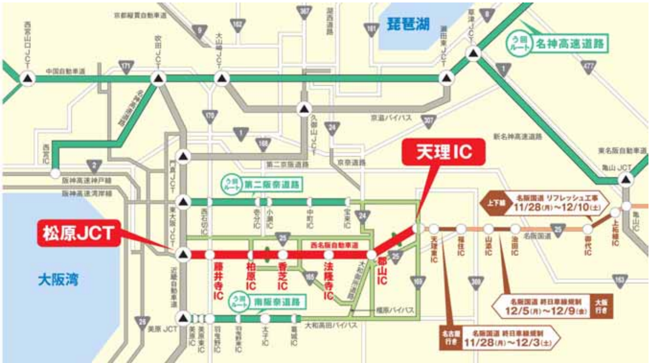
法隆寺インターチェンジ (IC) 終日閉鎖の案内図