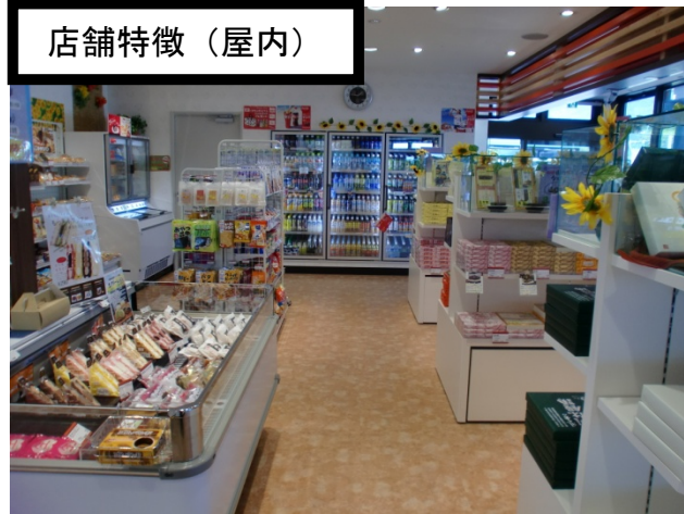
通路の広い店内でゆっくりお買いものをどうぞ