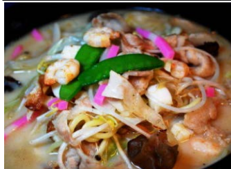
黒丸ちゃんぽん (780 円)