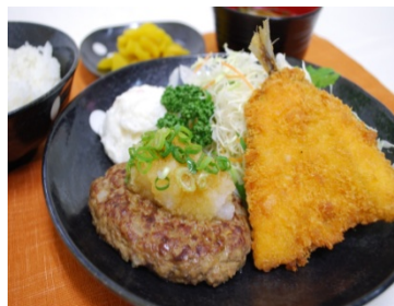
おろしハンバーグと アジフライ定食 (750 円)