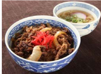
近江牛すき焼き丼セット (810 円)