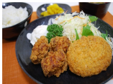
唐揚げ・コロッケ定食 (500 円)