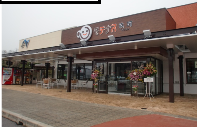
雨が降っても大丈夫、大屋根を完備