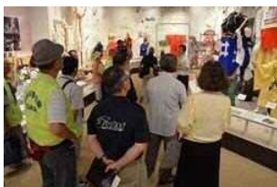
<祭りや芸能展示説明の様子>

舞鶴若狭自動車道全線開通の効果で、嶺北地域からの来館者が大幅に増えました。また、東海地方からのお客様も増えております。