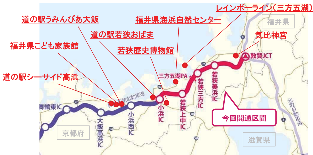
＜福井県嶺南地域の主要観光地所在地＞