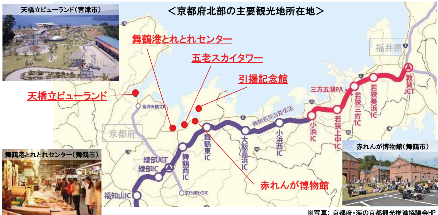
＜京都府北部の主要観光地所在地＞