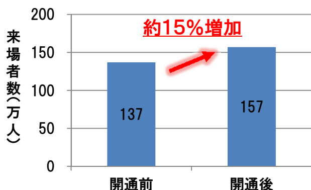
＜福井県嶺南地域の主要観光地来場者数＞