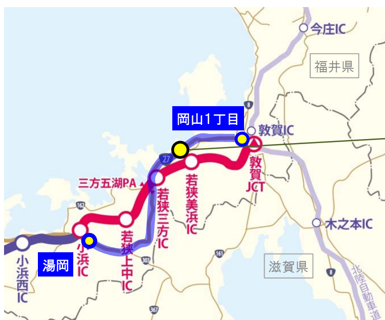
＜国道27号の交通量の変化＞