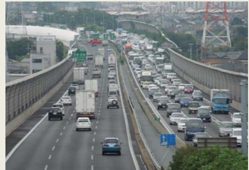
宝塚東トンネル付近