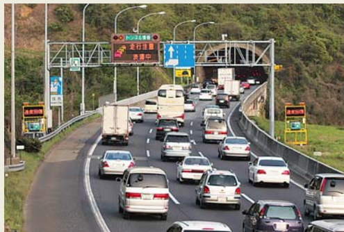
宝塚西トンネル付近