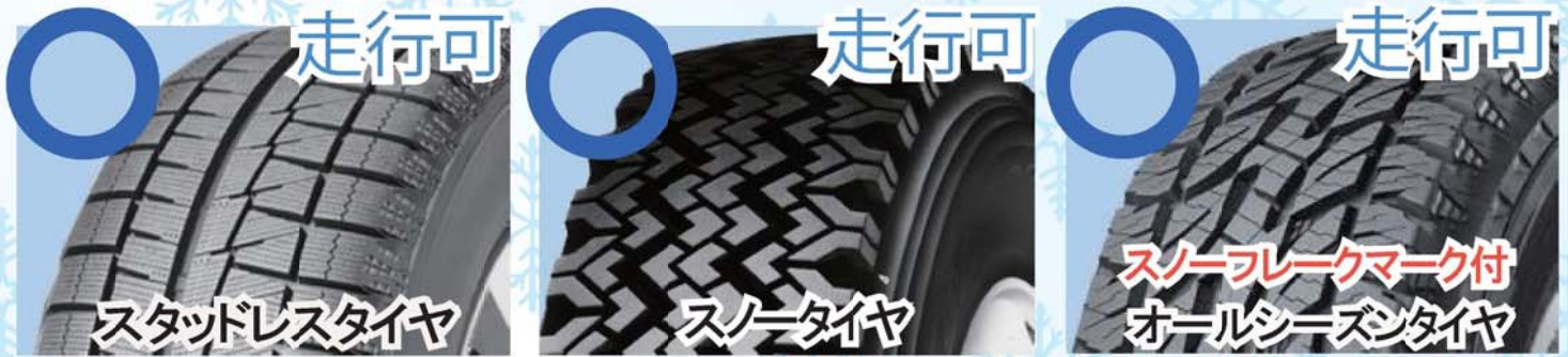
スタッドレスタイヤ