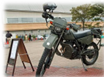
偵察用オートバイ