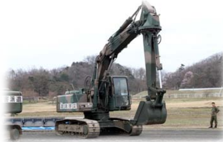
陸上自衛隊保有の施設器材