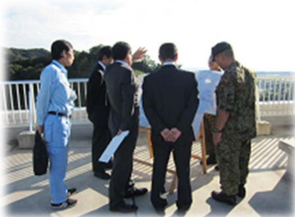
高知駐屯地調査(H24.10実施)