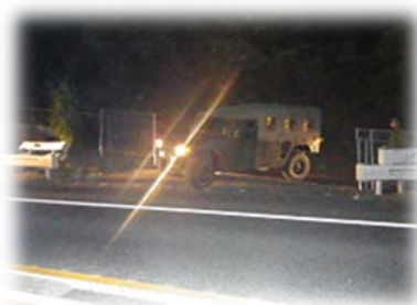
緊急開口部開放・通行訓練