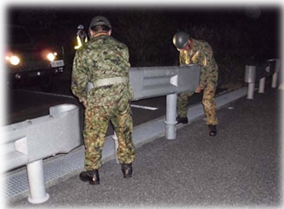
緊急開口部開放訓練(H24.10実施)