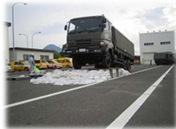
段差通行訓練(H24.9実施)