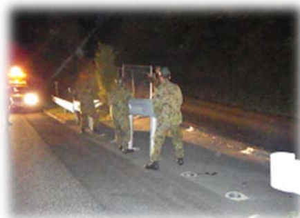
緊急開口部開放(訓練)

(5)第14旅団が、自らの通行のため高速道路及び施設を緊急復旧する場合の手続き《原協定第4条(3)関連》