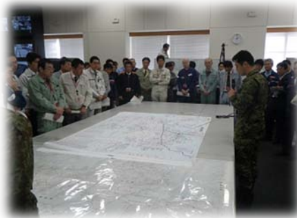
写真は広域合同訓練 (H24.3.6)の様子