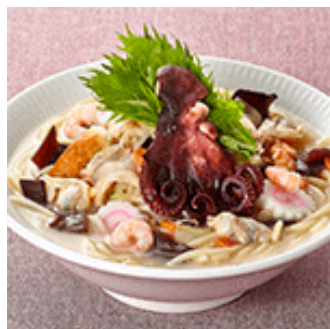
伝説のタコちゃんぽん 「泉だこ」を使用