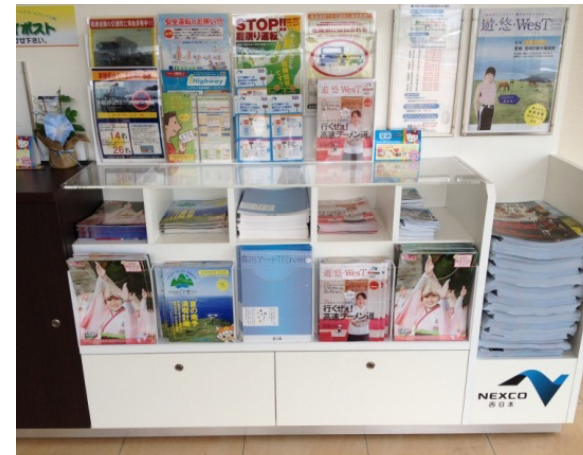
「情報カウンター」による地域情報リーフレットの無料設置