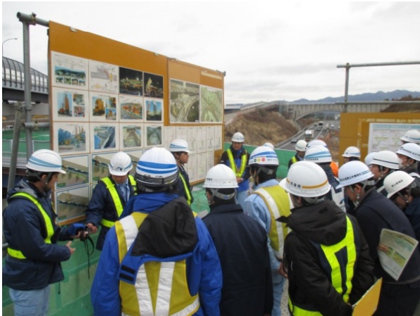
高速道路建設現場での技術講習会