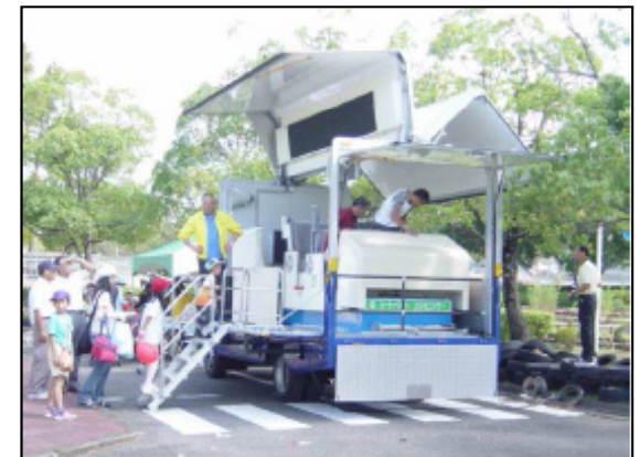
シートベルト効果体験(交通安全キャンペーン) 5