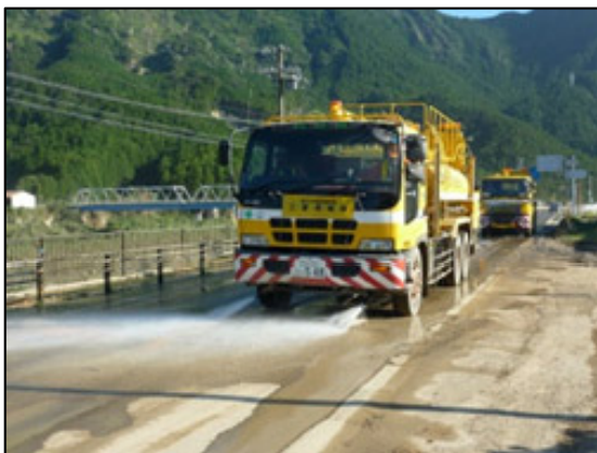
【災害時の復旧協力】