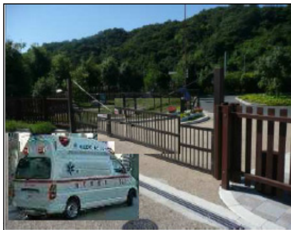
【緊急開口部の利用】