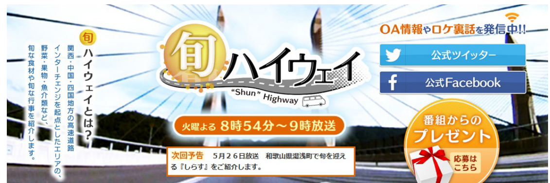
旬ハイウェイによる地域の旬な食材、旬な行事の紹介