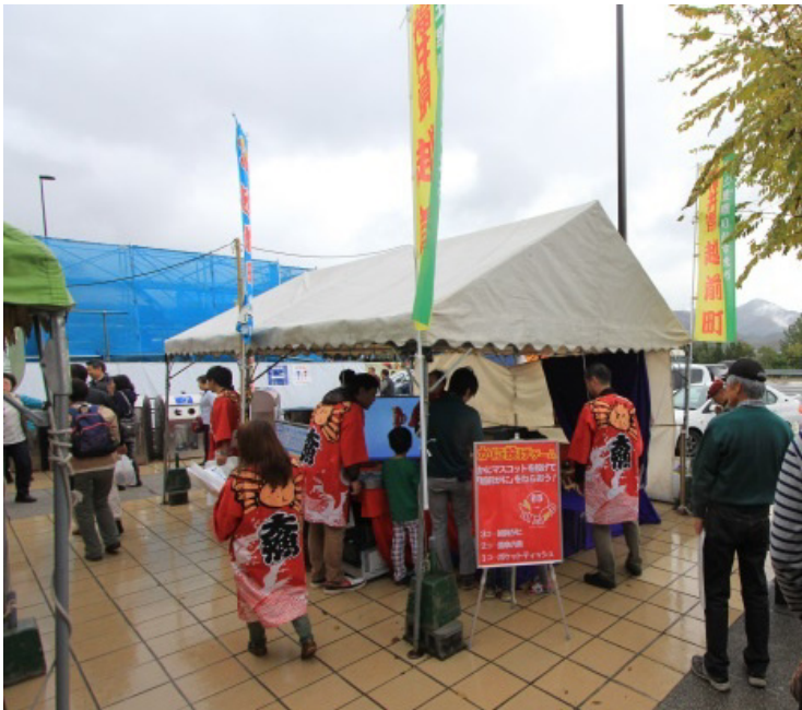
SA・PAでの観光PR・イベント等の実施