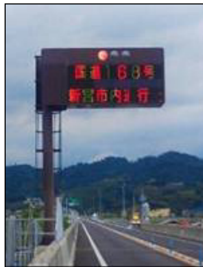
【一般道路情報の提供】