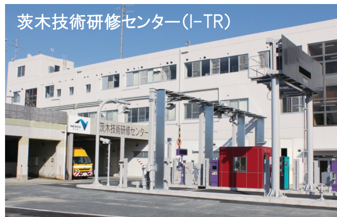
茨木技術研修センター(I-TR)