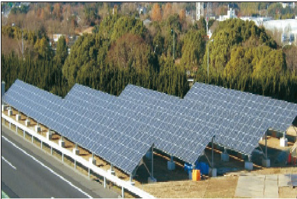
【太陽光発電などの設置】