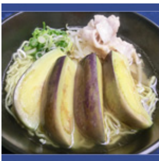
泉州水なすラーメン