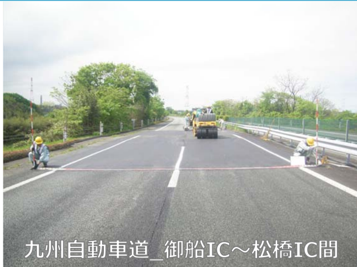
九州自動車道_御船IC～松橋IC間