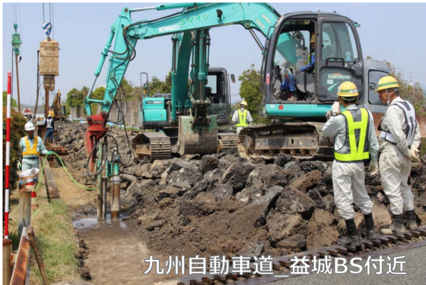
九州自動車道_益城BS付近