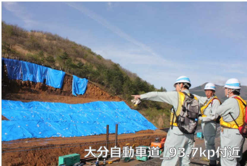
大分自動車道_93.7kp付近