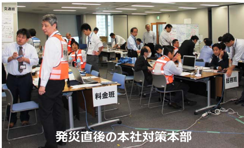
発災直後の本社対策本部

H28.4.14(木) 21時26分ごろ熊本地方で地震(最大震度7)が発生したため、災害対策本部が非常体制を発令