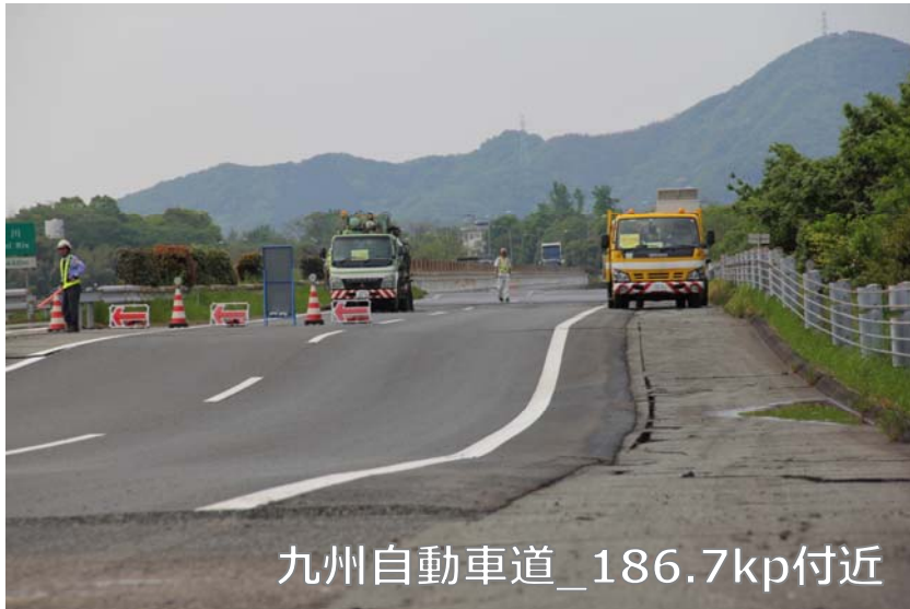
九州自動車道_186.7kp付近