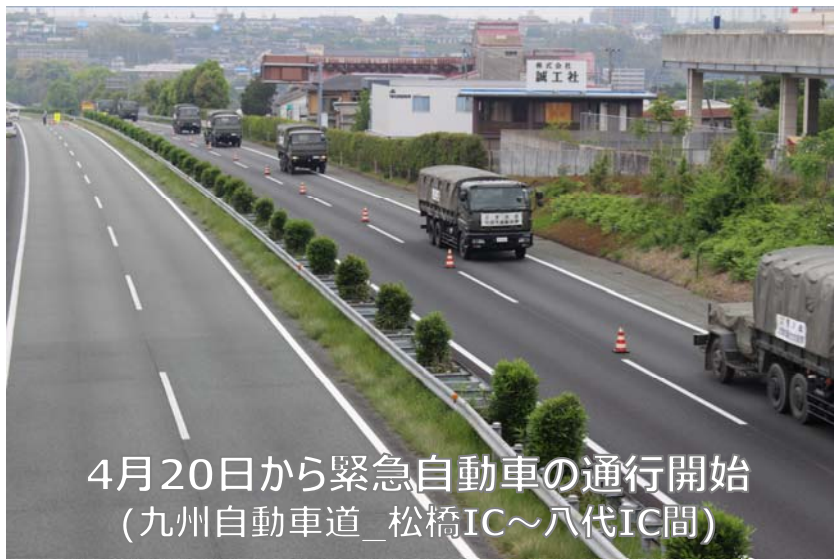
4月20日から緊急自動車の通行開始 (九州自動車道_松橋IC~八代IC間)