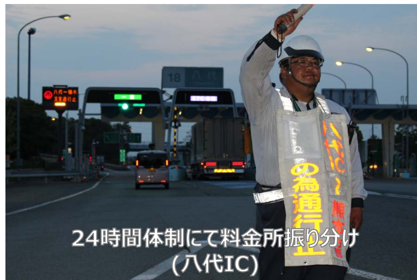
24時間体制にて料金所振り分け (八代IC)