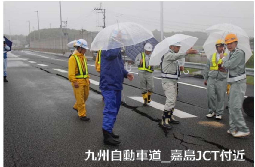
九州自動車道_嘉島JCT付近