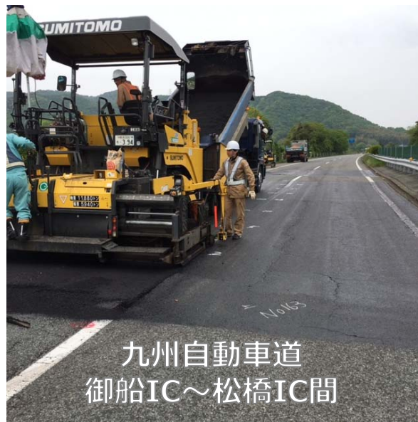
九州自動車道 御船IC～松橋IC間