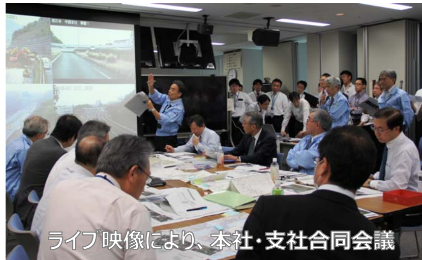
ライブ映像により、本社・支社合同会議