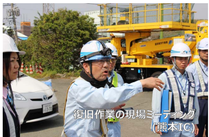
復旧作業の現場ミーティング (熊本IC)