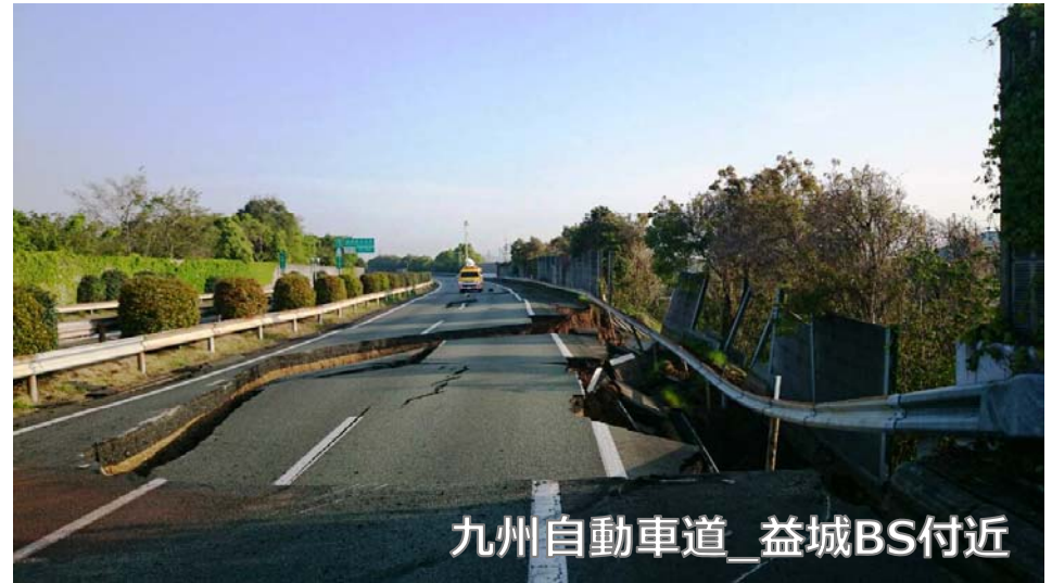
九州自動車道_益城BS付近