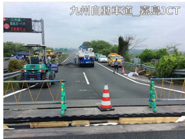
九州自動車道_嘉島JCT