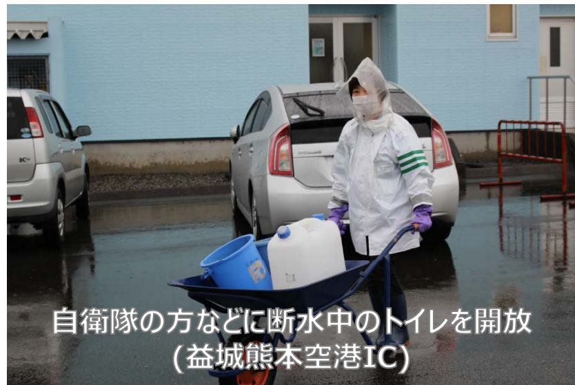
自衛隊の方などに断水中のトイレを開放 (益城熊本空港IC)