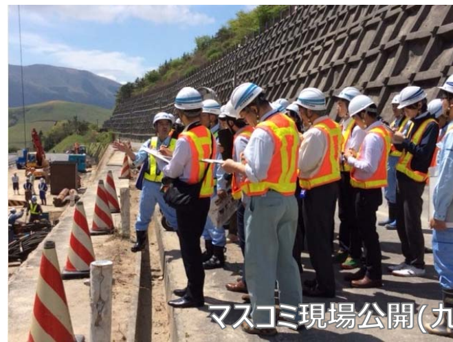
マスコミ現場公開(九州道2回、大分道1回)