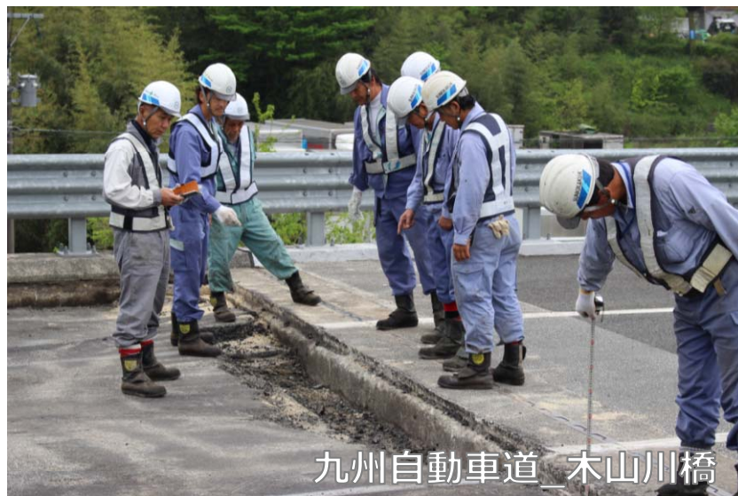
九州自動車道_木山川橋