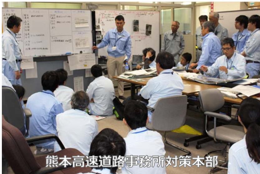
熊本高速道路事務所対策本部