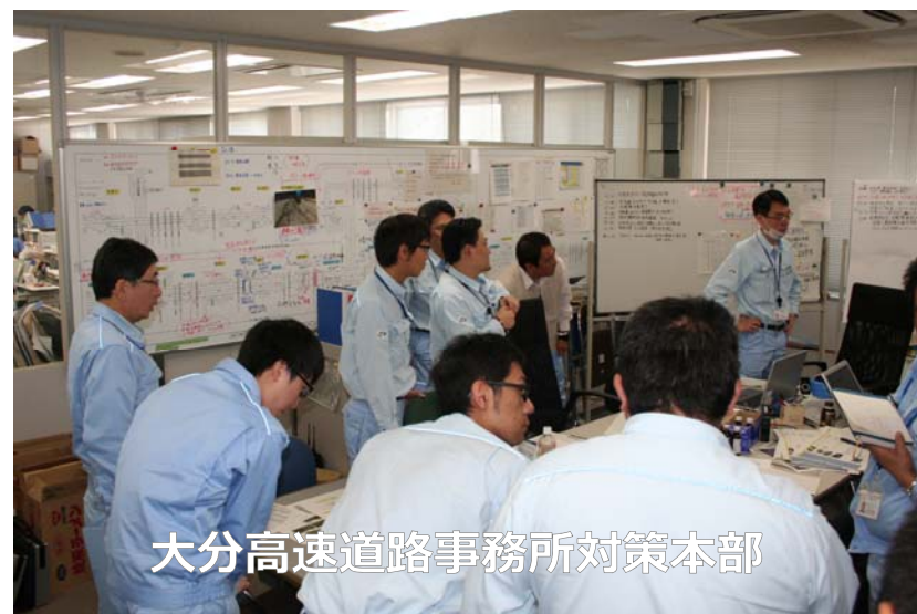
大分高速道路事務所対策本部