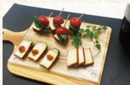
但馬屋食品 スモーク豆腐【とうふ焼】