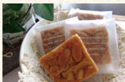
贈り物菓子食堂 Mouette 焼き菓子