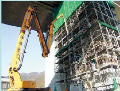
耐震補強工事一例