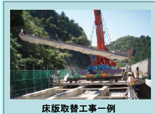
床版取替工事一例