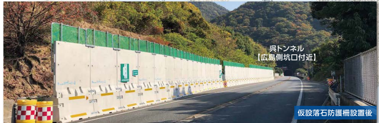
呉トンネル 【広島側坑口付近】