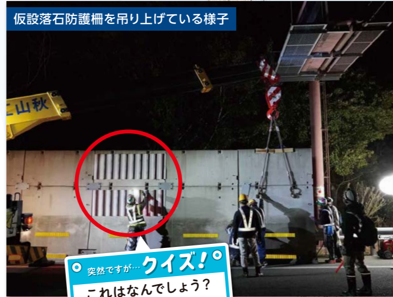
仮設落石防護柵を吊り上げている様子