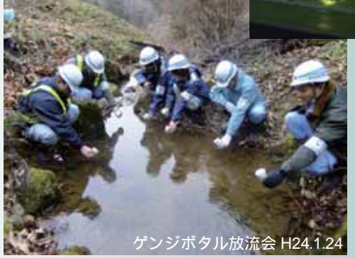
ゲンジボタル放流会 H24.1.24