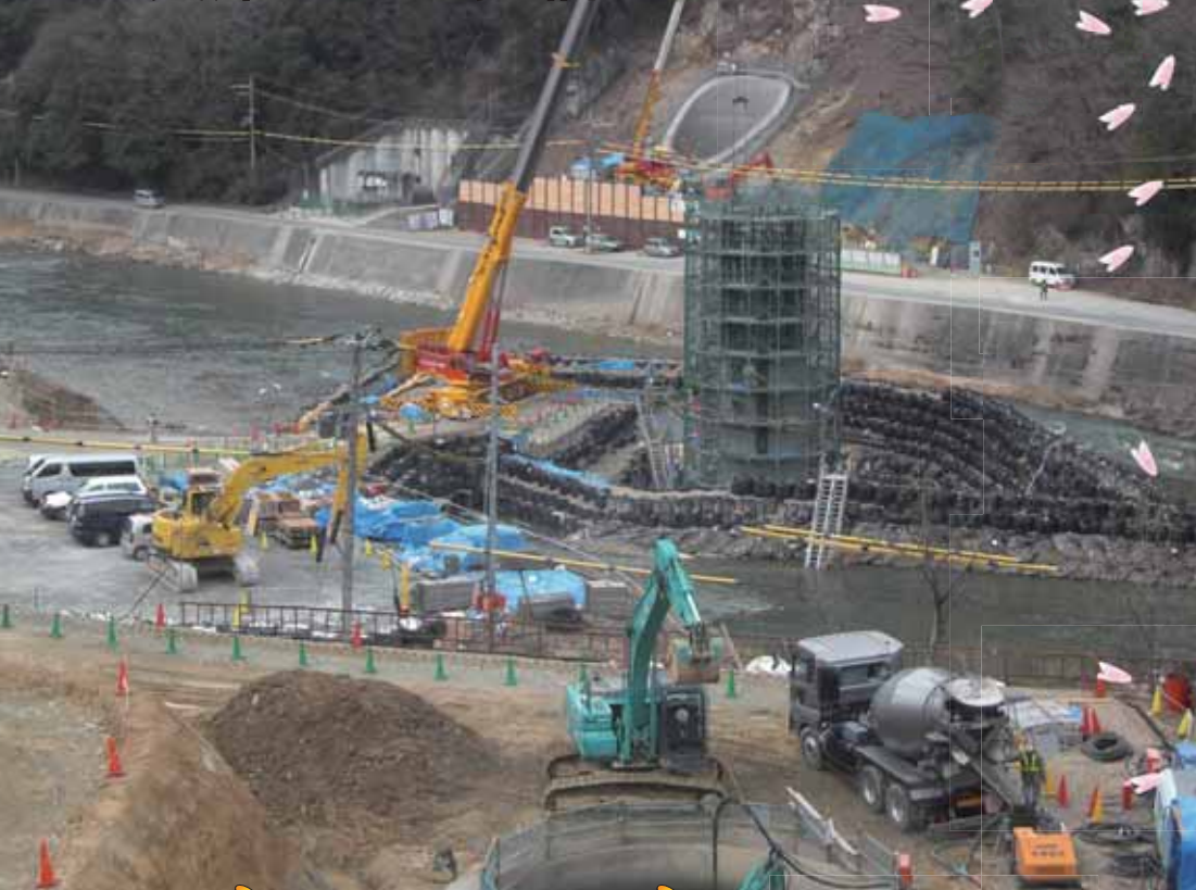
写真：武庫川橋工事