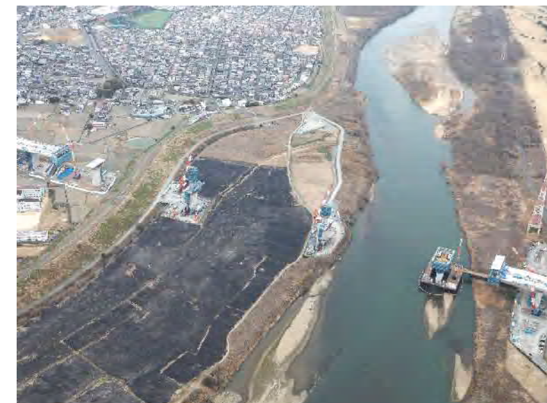
⑤ 橋梁上部工の施工を行っております。