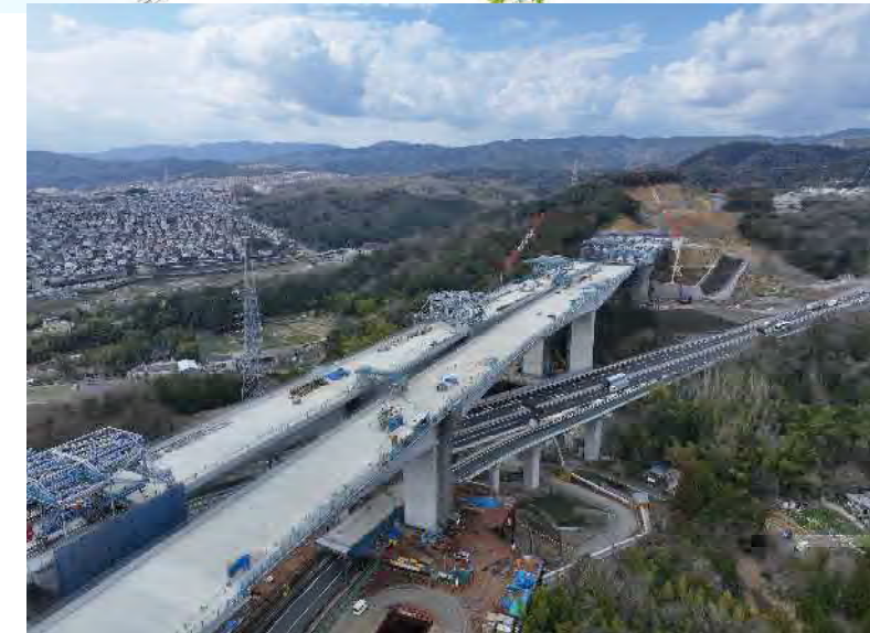
① 橋梁上部工及び橋台の施工を行っております。