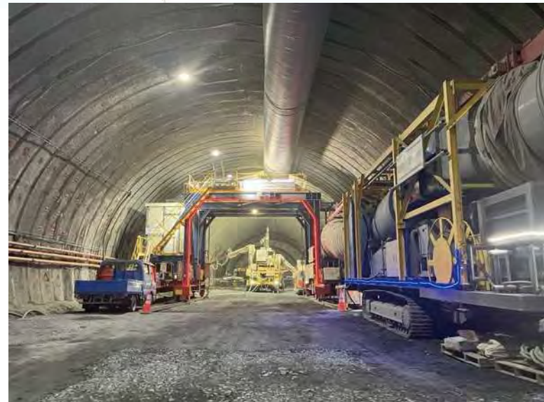
② トンネルの掘削を行っております。