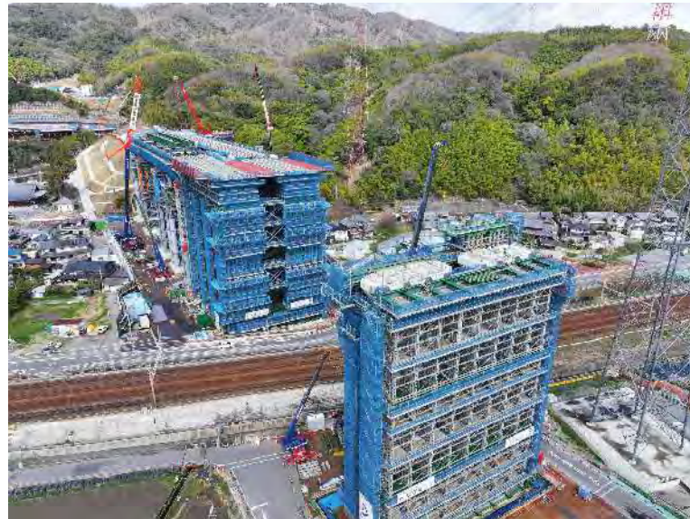
③ 橋梁上部工のための仮設備（ベント）の施工を行っております。