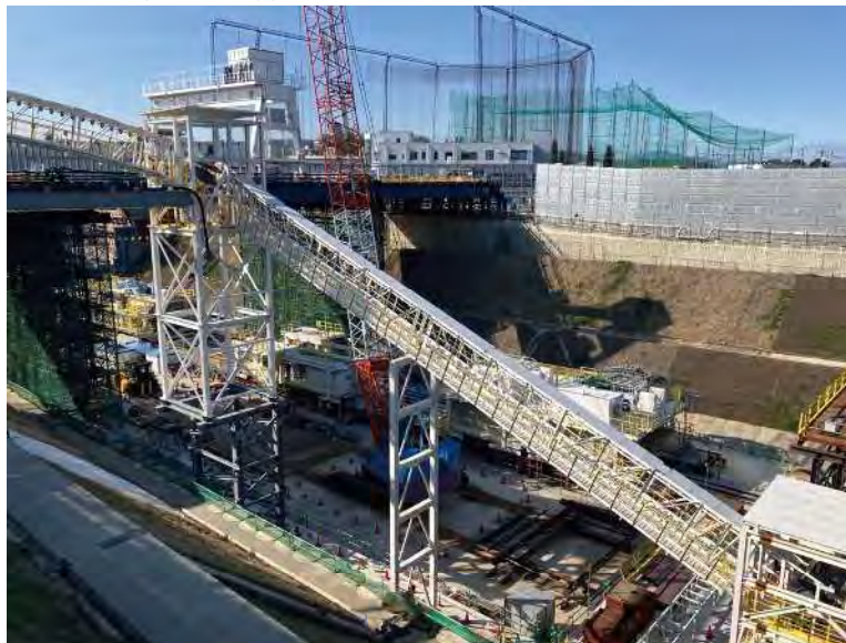
⑦ トンネル掘削のための設備構築を行っております。