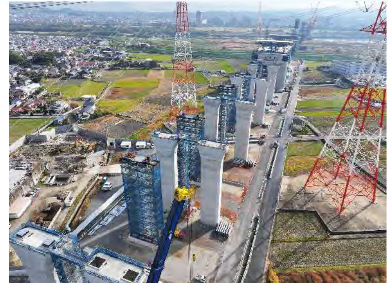
④ 橋梁上部工の架設を行っております。