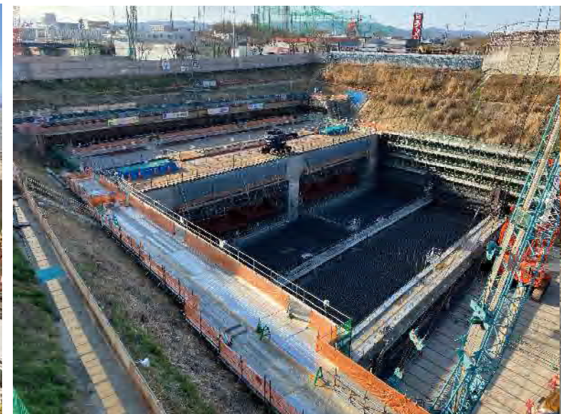
⑧ 推進BOXの施工を行っております。