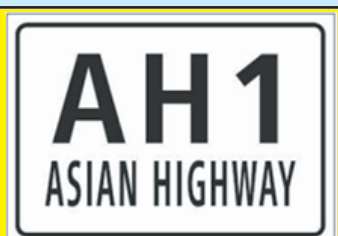
【日本におけるアジアハイウェイの標識】

日本におけるアジアハイウェイ1号線の路線は、日本国道路元標のある日本橋を起点とし、東名高速道路、名神高速道路、中国自動車道、山陽自動車道、関門自動車道、九州自動車道、福岡高速道路を経由して、釜山につながるフェリーに連絡しています。