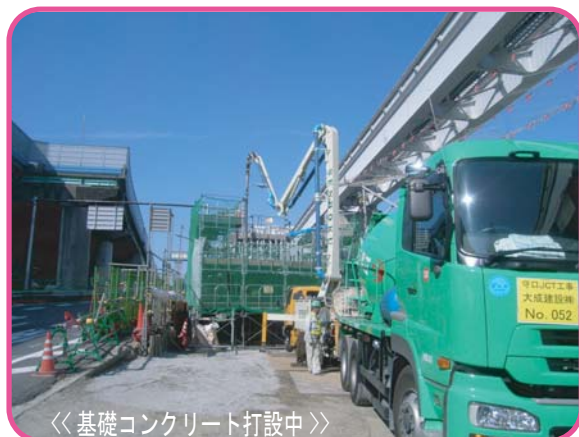
基礎コンクリート打設中

大阪中央環状線を規制し、直径5.5mの円柱状の基礎を地中に2.7m押し込みながら埋めていきます。工事は大阪モノレールに近接しているため、モノレールの橋脚を監視しながらの施工を実施しています。