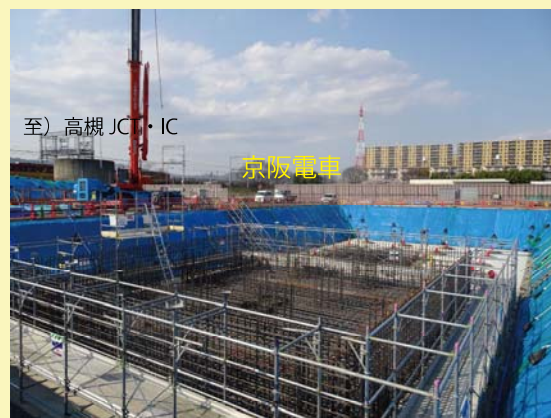
④ 京阪電車沿線で橋脚の基礎となる部分の施工を行っています。