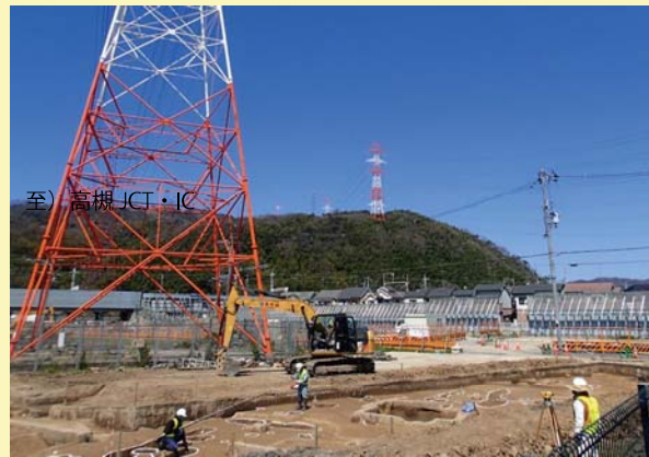
① 橋脚工事を行う前に、埋蔵文化財発掘調査を実施しています。