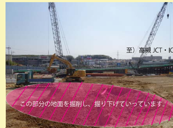
⑥ 八幡市域で土留め用鋼管の打設を開始し、新名神の道路の高さまで地面を掘り下げていっています。