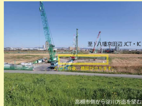
② 淀川両岸で橋脚の基礎となる部分の施工を行っています。