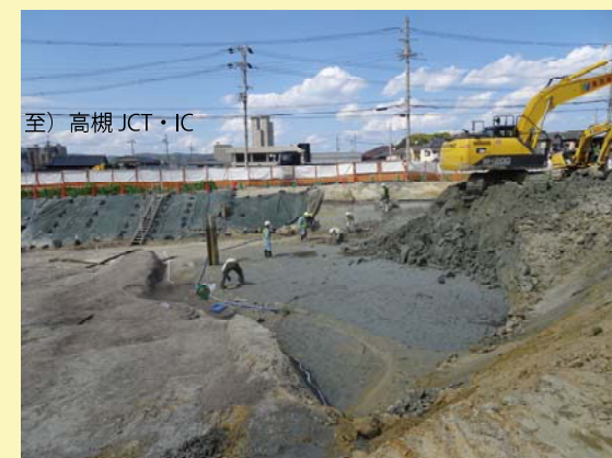
⑤ トンネル西坑口(※2) 工事を行う前に埋蔵文化財発掘調査を実施しています。