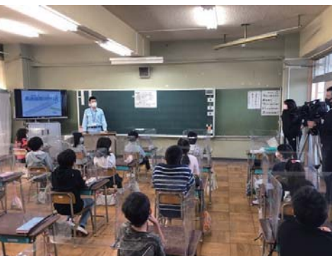
～出張学習会の様子～

新名神大阪東事務所では10月28日に八幡市立有都小学校にて1～3年生を対象とした出張学習会を行いました。学習会では高速道路がどのように作られているかの説明を行いました。 高速道路建設に関する授業ということもあり、難しくわからないことも多かったようですが、高速道路に興味を持ち、授業を行った社員に「高速道路は完成するのにどれぐらいの時間がかかるの？」と質問をする児童も見られました。 また学習会の後は、ドライブシミュレータにて、VRにて再現された新名神高速道路上の運転体験も実施しました。 ゲームで車の運転をしたことがある生徒も多く、「(ゲーム上で) ママより運転できる！」や「僕、車の運転上手いで！」と自信満々な生徒もいましたが、ハンドルの形をしたコントローラーを実際に握り、初めて行うハンドル操作に「楽しい!」「思ったより難しい!」とわくわくしながら運転を楽しむ姿が見られました。