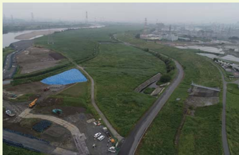
③ 本線工事に向けた準備をしています。