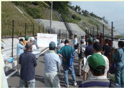
① 成合地区で地元説明会を開催しました。