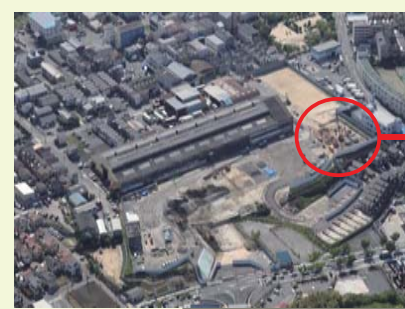
⑤ 本線工事に向けた準備をしています。