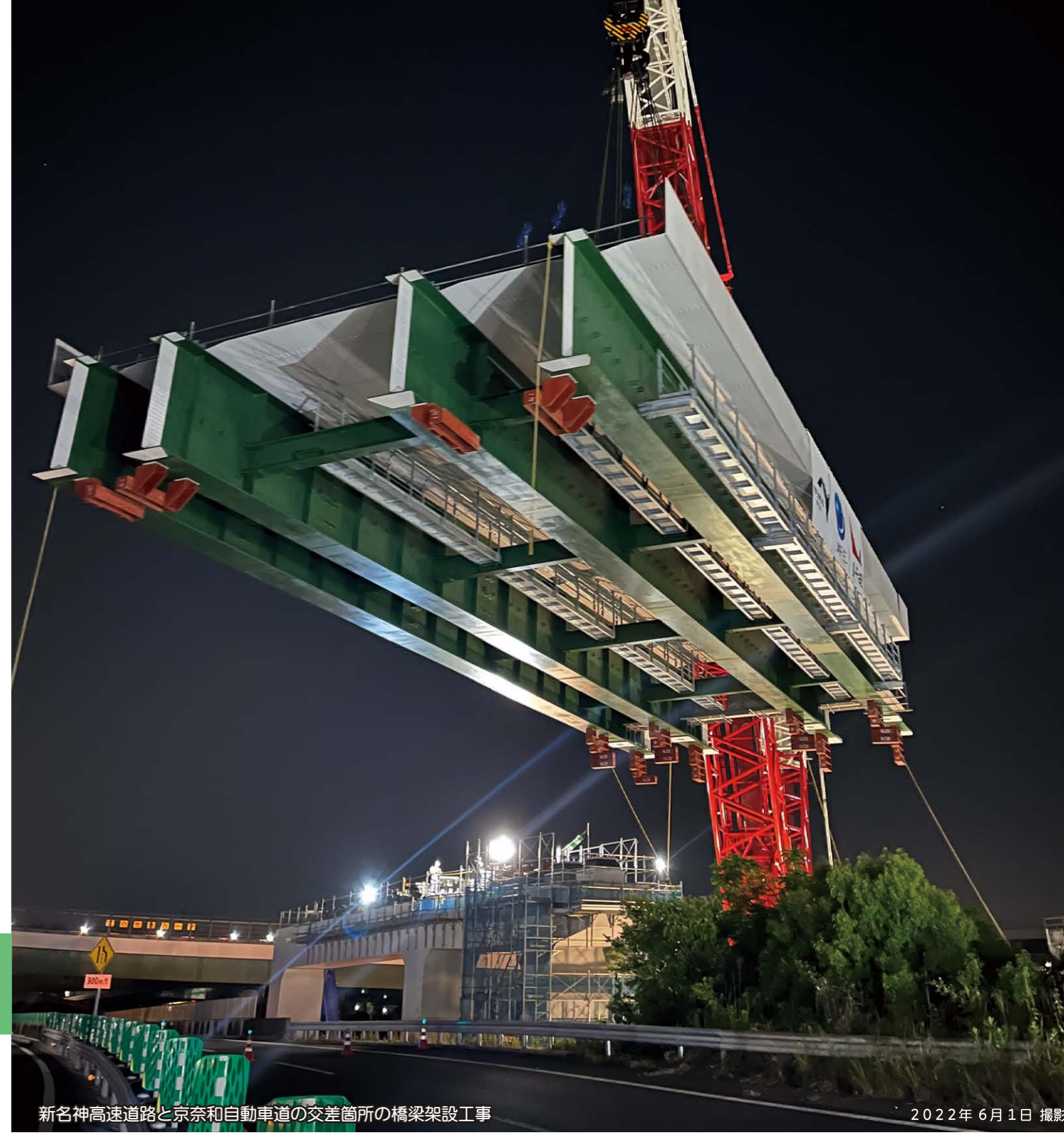
新名神高速道路と京奈和自動車道の交差箇所の橋梁架設工事