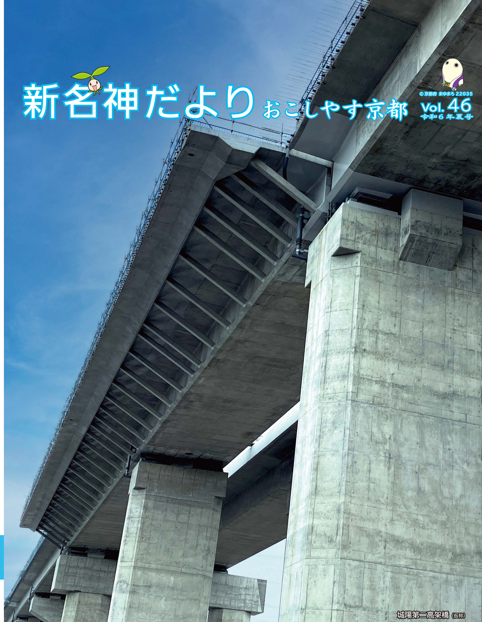
城陽第二高架橋(仮称)

関西・京都を活性化する「新名神高速道路」 いまよりもっと便利に楽しく 京都の事業進捗情報